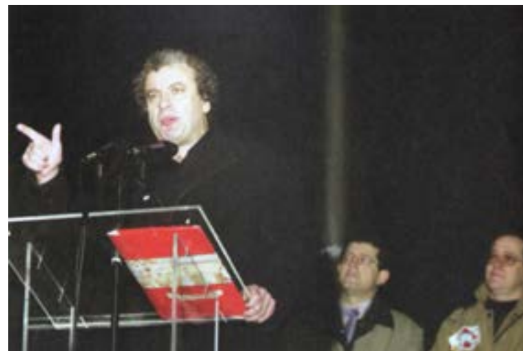
José María Calleja kazetaria, bere hitzaldiaren une batean.