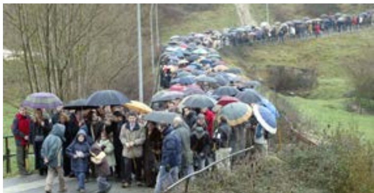
Euripean, jendetza kanposantutik Etxarri-Aranazko herrigunerantz doa.