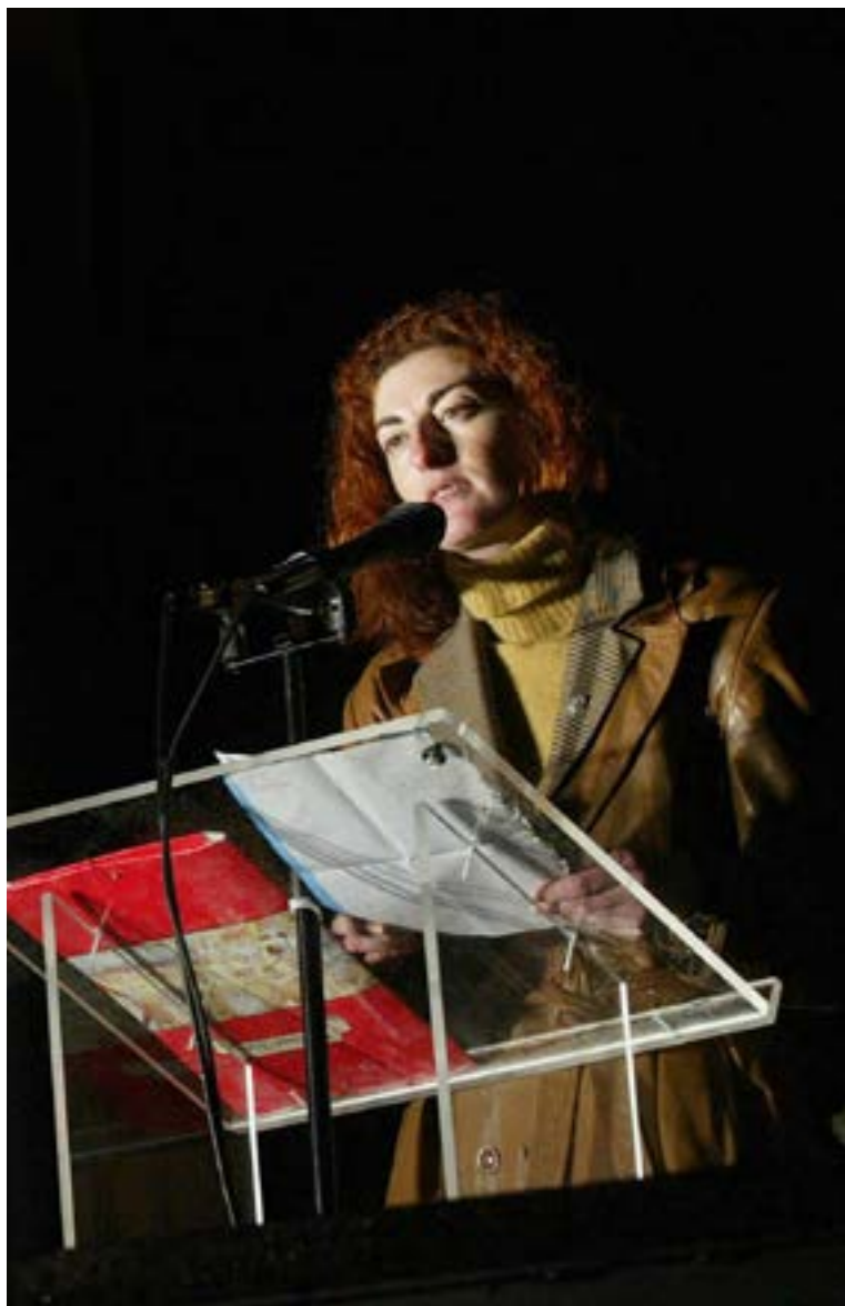
Maite Pagazaurtundua plazan egindako ekitaldian.